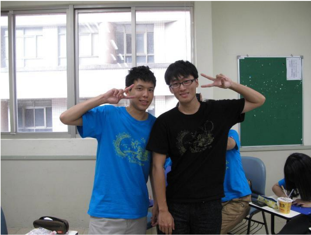
2012.08 大學裡第一個舉辦的營隊